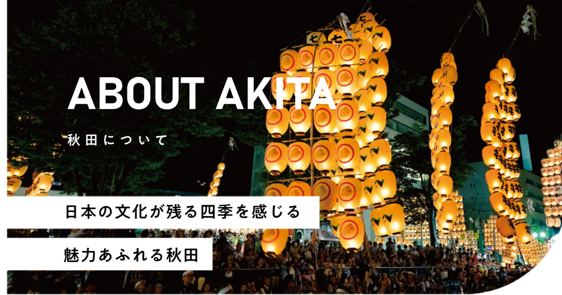
竿燈まつり Kanto Festival

You can always consult with the life counseling staff about life and the faculty about studying. In addition, we hold personal interviews once every three months.