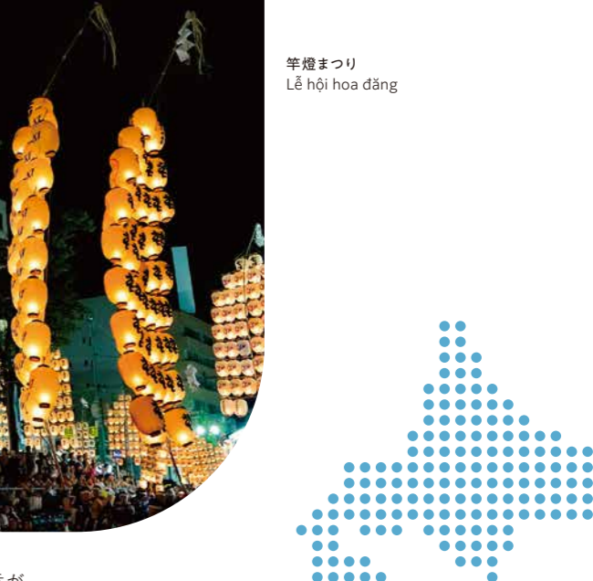
竿灯まつり Lễ hội hoa đăng

Xung quanh trường có nhiều trung tâm thương mại, nhà hàng và đặc biệt có cả khu văn hóa như bảo tàng mỹ thuật, thư viện tạo nên một môi trường học tập, sinh hoạt đầy đủ và ý nghĩa. Ngoài ra, Thành phố Akita là khu vực có thiên nhiên phong phú, vị trí địa lý gần cả núi và biển, các bạn sẽ được sống trong 1 khu vực vừa cảm nhận được nét đẹp 4 mùa, thiên nhiên trù phú cũng như vừa tận hưởng được cả những tiện ích ở nội đô thị.